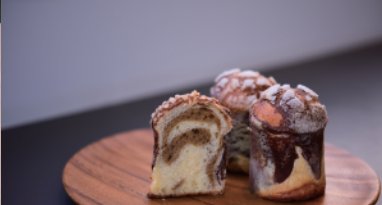
龍田古道 メロンパン (a bread of fresh air)