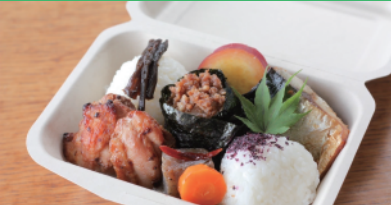
tokotoko OBENTO (verygoodtabledeli)