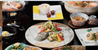
日本遺産 龍田古道・亀の瀬 特選コース (旅亭十三屋)