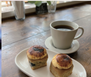
信貴の郷カスタードブリュレ (ボン・シック)