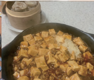
Teppan 麻婆丼セット 亀の瀬 Ver. (中国料理 山丁)