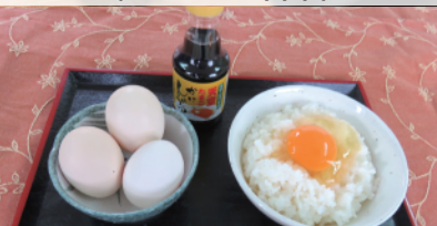
天空さくら卵かけごはん (農業公園信貴山のどか村)