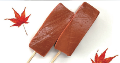
もみじ串コン (農業公園信貴山のどか村)