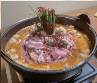
ドロコロ火山鍋 (ちゃんこ三賀)