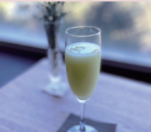
亀の瀬サムライロック (柿本家)