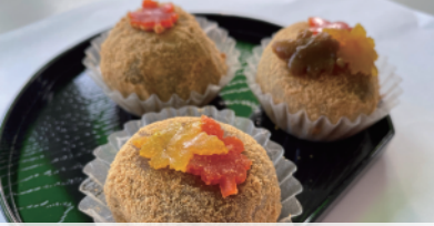
龍田の華、龍田の小径 (オカヤ堂)