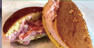
春うらら 龍田古道「生ドラまん」- 古都華 - (手作りの洋菓子 やまもと)