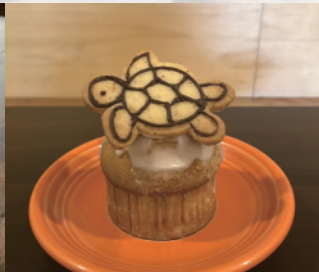
亀のせマフィン (サンドイッチパル)