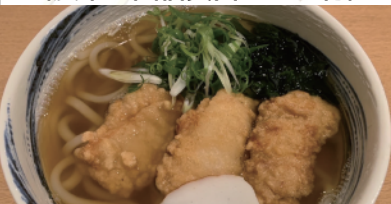
川面に紅葉 竜田揚げうどん (うどん山川)