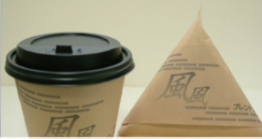
龍田 風のブレンド (自家焙煎カフェ Slack Tisa)