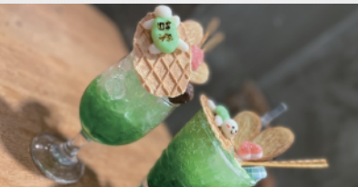
亀クリソ (シーフード智栄)