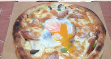
万葉野菜ピザ (農業公園信貴山のどか村)