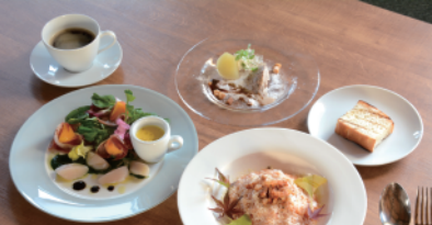
龍田古道ランチセット (イタリアンレストランひのでや)