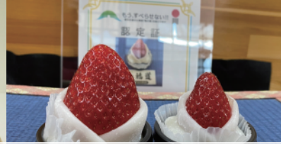
龍田姫苺大福 (一福道)