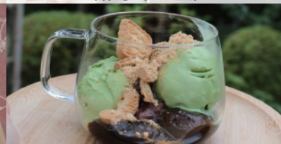
亀の瀬パフェ (はちわれコーヒー)