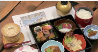
たつた弁当 (信貴山観光ホテル)